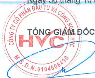
Trần Hữu Đông